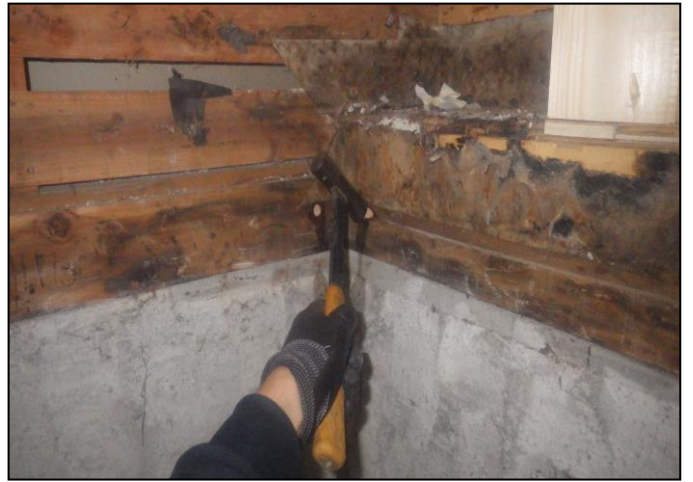
壁面: 木部処理剤吹付け