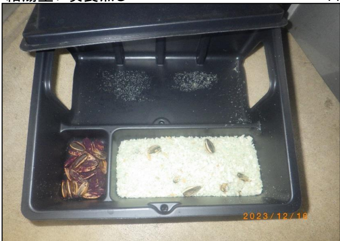
11月24日(金) 給湯室:喫食無し 14