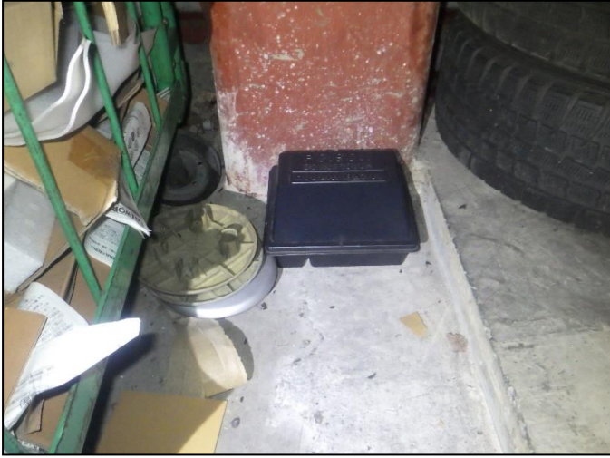
倉庫内: 殺鼠剤設置