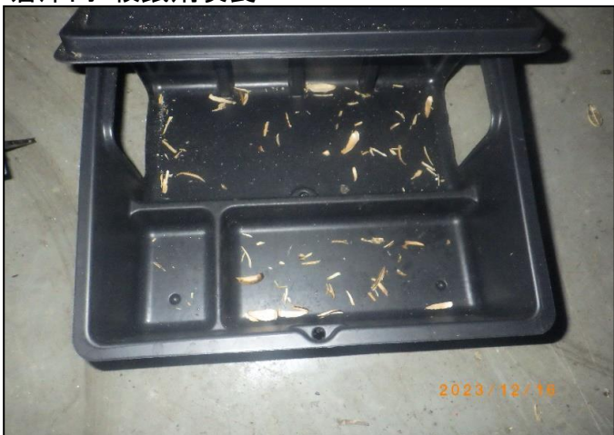
倉庫内:殺鼠剤喫食 16