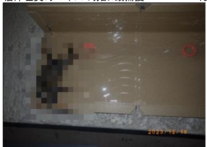
倉庫左奥:クマネズミ幼獣1頭捕獲 15