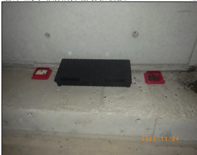
倉庫左奥:殺鼠剤、粘着板新設 12