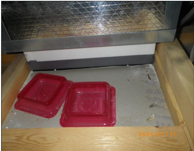
C天井裏:殺鼠剤に喫食確認 6