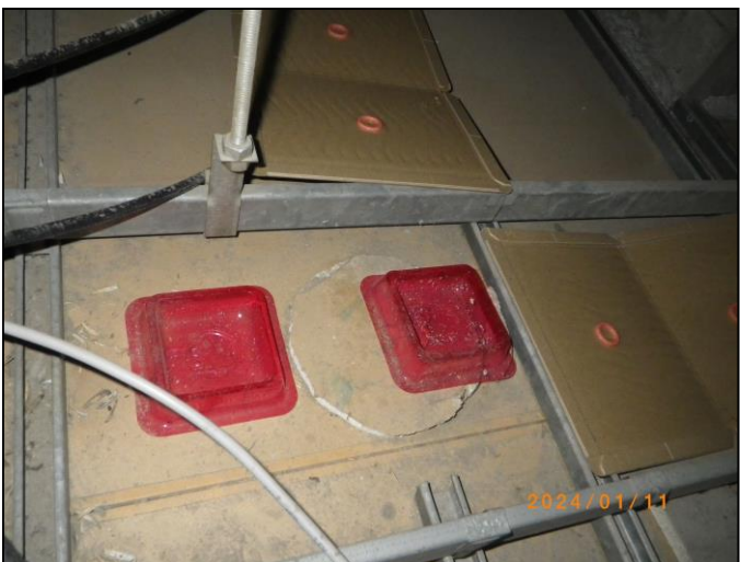
通路天井裏:殺鼠剤に喫食確認 10