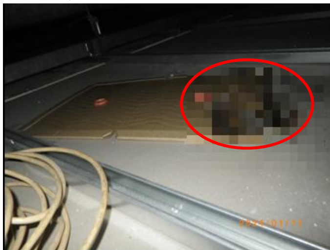
通路天井裏:ネズミの捕獲を1頭確認 9